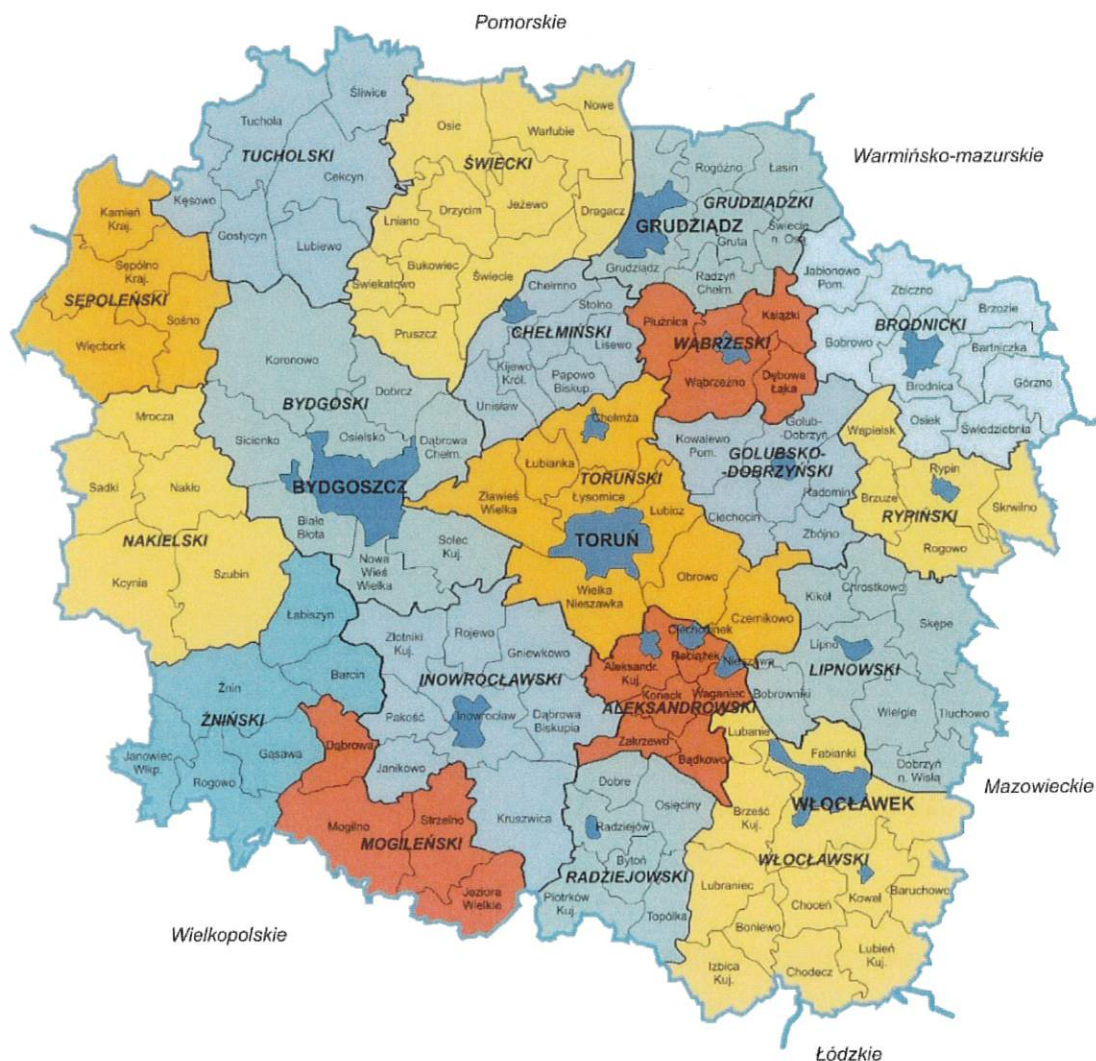
Rysunek 1. Gmina Łubianka na tle województwa